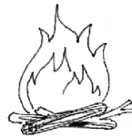
Feu de camp